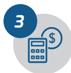
Elaboração e captação