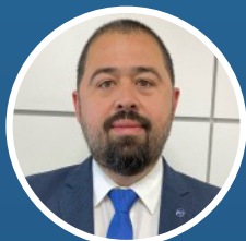
André Alves Secretário Especial Adjunto do Esporte