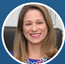
Michelle Moysés Melul Vinecky Secretária Nacional de Incentivo e Fomento ao Esporte