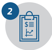
Prestação de Contas Financeira