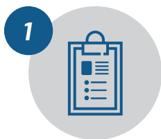
Prestação de Contas do Objeto

A Prestação de Contas Final será analisada em duas fases , sendo essas: